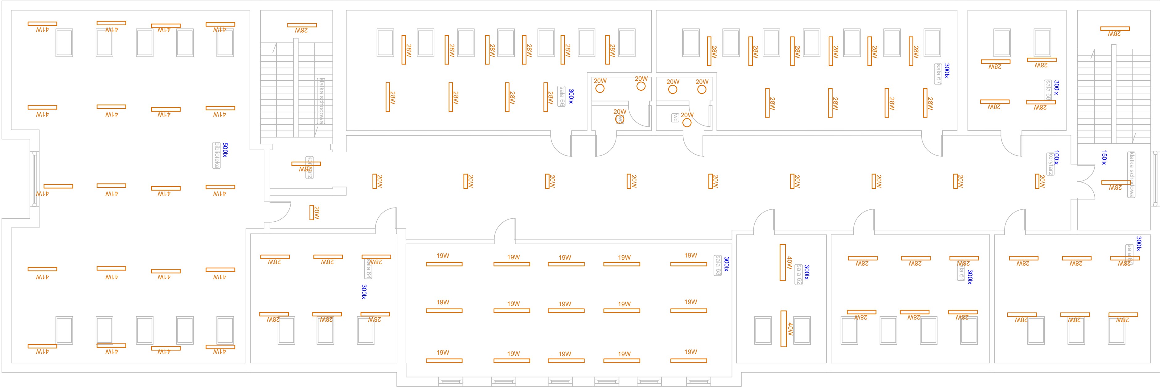
LEGENADA OPRAW WG ZAŁĄCZNIAK NR 1 DO PROJEKTU